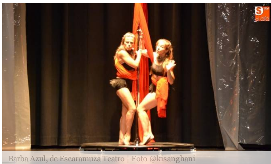
Barba Azul, de Escaramuza Teatro

CIUDAD RODRIGO | Durante la mañana del sábado se estrenaron 'Barba Azul' de Escaramuza Teatro y 'La ratita presumida' de Festuc Teatre